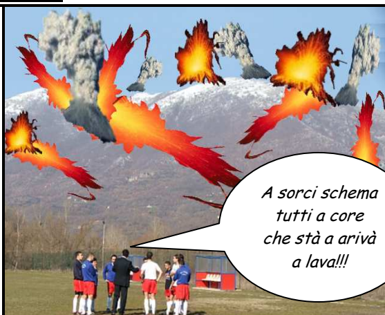
Nella foto n°2, al Real di quest'anno ne succedono di tutti i colori.....manca solo che un vulcano nascosto sotto Cervia torni all'attività ed inizi ad eruttare durante una partita e poi sarebbe il massimo della sfiga. Ma la supereremo!!!