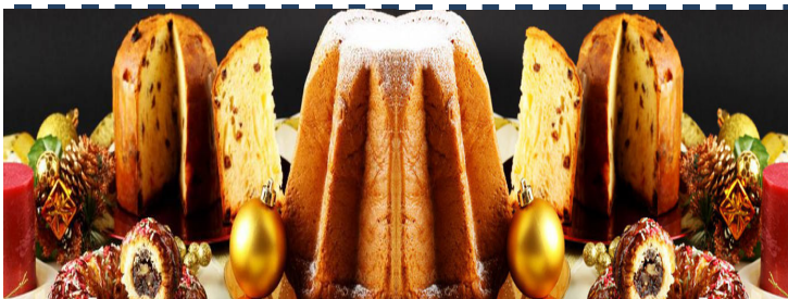
Pausa del campionato, abbuffate Natalizie e anno nuovo!!!