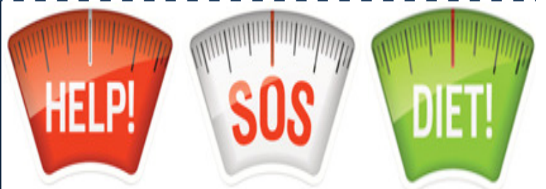
ALLARME BILANCIA!!!...e nuovo regime alimentare per tutti!