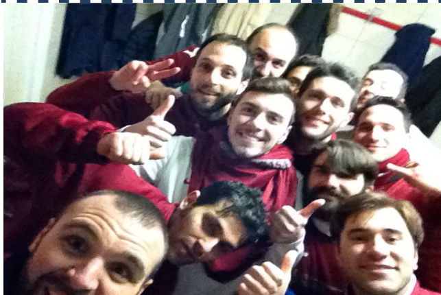
Real Turania Selfie