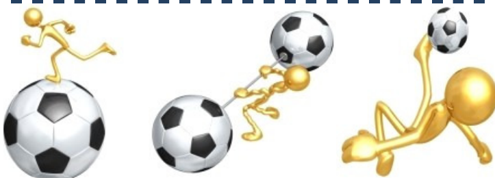
Per il Real durante le Feste corsa, atletica e partite!!!